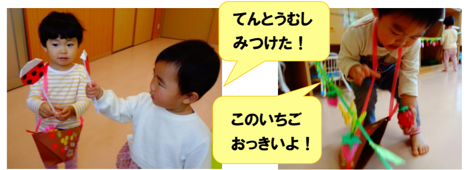
てんとうむし みつけた！