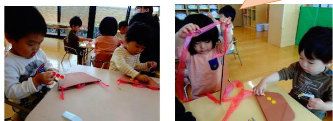
ぺったん♡ みてみて♪たくさんはれたよ♡

見つけた春を入れるバッグに、飾り付けをしました。ほし組さんは指先を使うことが、少しずつ上手になり、自分でシールを取って貼っていました。 つき組さんは「ここはあか！」と保育士やお友だちとお話をしながらたくさん貼っていました。